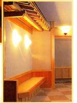
ロビー・フロント