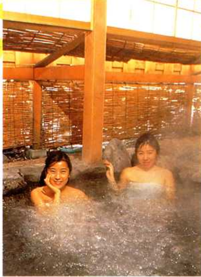
プロアー効果時の露天風呂